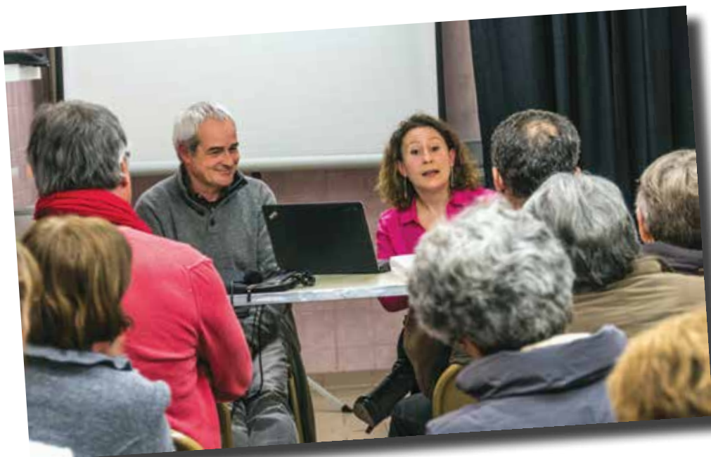
Réunion publique sur la démocratie participative du 21 février 2014.

Ces conseils sont force de propositions pour les projets de la Ville et pour un budget participatif.